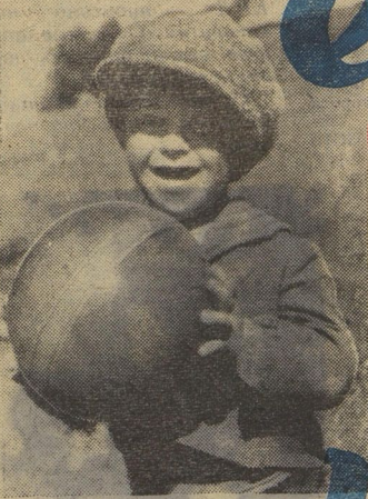
Фотографии «ПТИЧИЙ РАЗГОВОР», «И Я ХОЧУ ИГРАТЬ!», «ПЛЯСКА» получены на фотоконкурс «ЗОРКИЙ — ДРУЖБА — 50». Их сделали Тенгиз Гагау из г. Тондиси, Миша Леонов из Ленинграда, Вася Малинин из г. Петрозаводска.