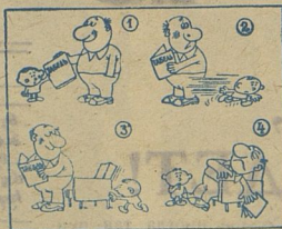
БЕЗ СЛОВ. Из липовского жур-нала «Штука» («Мелга»).