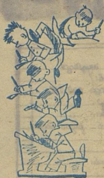
АКРОБАТИКА НА АРИФМЕТИКЕ. Рис. С. Антонова.